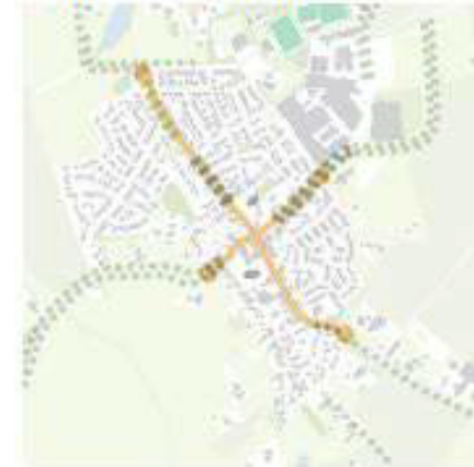
LEVENDIG EN GROEN DORPSPLEIN BIJ KERK